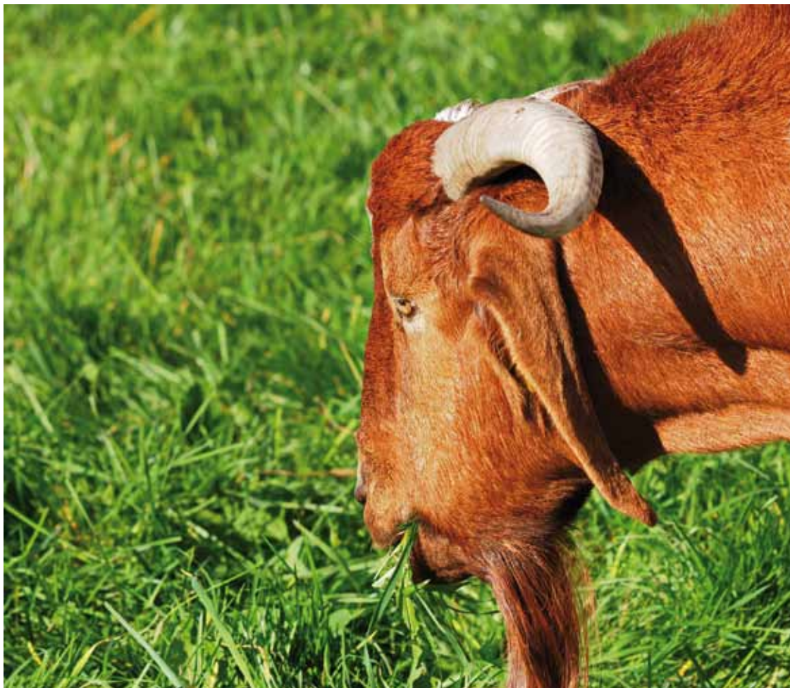
Gott erlaubt uns, „Ziegenhaare“ auf den Altar zu legen.

Almosen eures Gebetes zukommen zu lassen und ihre Schuld an Meine Gerechtigkeit abzuzahlen“ (Oster-Novene Achter Tag). „Mein Jesus, Barmherzigkeit“ 300 Tage Ablass = zehn Monate für drei Worte jedesmal. Zehnmal, zwanzigmals ... hundertmal. = 82 Jahre Ablass. Nie habe ich gehört, die Kirche habe gewährte Ablässe zurück genommen – gebetet müssten sie werden !!!