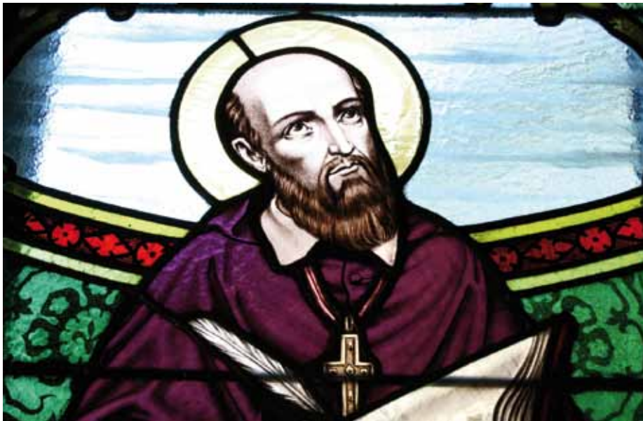
Franz von Sales, der Heilige der kleinen Schritte (Glasfenster in der Kapelle der Oblatinnen des hl. Franz von Sales in Wien, Österreich)

„Hüte dich vor allem, seine Hand loszulassen und dich seiner Obhut zu entziehen, in der Meinung, du könntest dann mehr zusammenraffen. Hält er dich nicht mehr, dann wirst du keinen Schritt tun, ohne hinzufallen“ (ebd.).