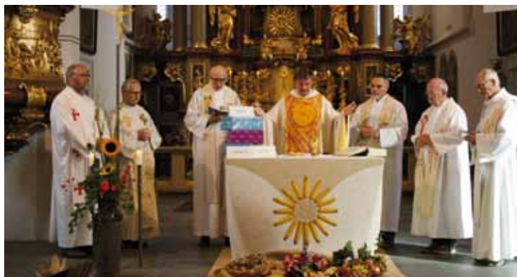
Gottesdienst in der Wallfahrtskirche Mank

E twa 100 Teilnehmerinnen und Teilnehmer beteiligten sich an der Fußwallfahrt der Oblatinnen und Oblaten des heiligen Franz von Sales am Samstag, 6. Oktober 2018. Die Wallfahrt führte bei strahlendem Herbstwetter entlang des alten Manker