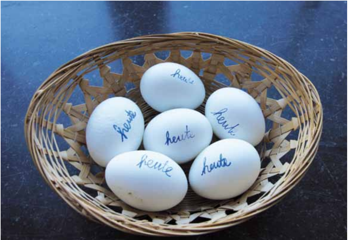
Eier von heute oder – von welchem Tag?

dieses von manchem als etwas Ungewöhnliches empfunden. Man kann sich auch über diese Abwechslung, die in das Gewohnte eintritt, freuen. Das Gewohnte, das gewöhnliche Tun fließt so dahin wie das Wasser in einem Bach, das in geordneten Bahnen in seinem Flussbett seinen gewohnten Weg nimmt.