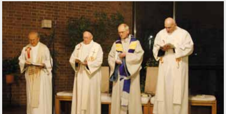
Eucharistiefeier zur Gelübdeerneuerung

Am 21. November 2018 erneuern die Ordensgemeinschaften der salesianischen Familie traditionell ihre Ordensgelübde. Die Sales-Oblaten der Wiener Region versammelten sich dafür in der Franz-von-Sales-Kirche in Wien, 10. Bezirk, Favoriten. Zunächst diskutierten sie über das Thema „Wie kann die Kirche heute die Jugend an-