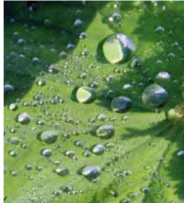
Ist nicht auch ein Regenguss für eine Blume lebensnotwendig?

verbreiten. Sein Kloster, das Salesianum Rosental in Eichstätt, schien mir dafür der perfekte Ort zu sein. „Franz von Sales würde sagen, dass du in deine Pfarrgemeinde gehörest“, bekam ich als Antwort zu hören. Und genau dort leite ich nun seit sechs Jahren den Franz von Sales-Jugend- und Kinderchor, deren T-Shirts und Sweat-Shirts Franz von Sales-Zitate schmücken.