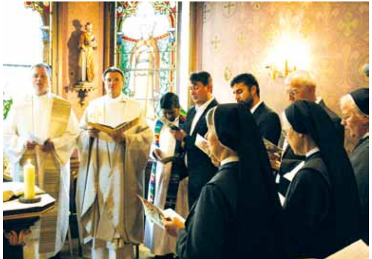
Gemeinsame Eucharistiefeier anlässlich des Jubiläums

Schweiz, Namibia, Südafrika, Ecuador, Kolumbien und in den USA.