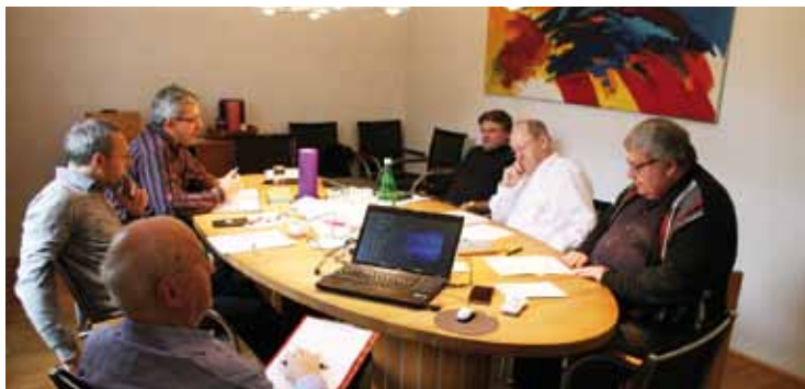
Konzentriertes Gespräch bei der Provinzkonferenz

A m Montag, 29. Oktober Ideenbörse 2018, tagte die Provinzkonferenz der Sales-Oblaten im Provinzialat in Wien, Kaasgraben. Die Provinzkonferenz ist eine Art Ideenbörse bzw. beratendes