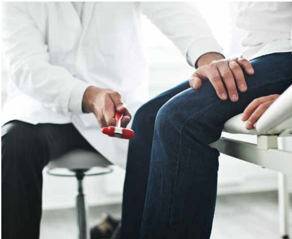
Die Notwendigkeit, aufs Detail zu schauen – unserlässlich für den Arzt wie auch für das Leben überhaupt

fehlerhafte Stelle zu finden. Ebenso ist es in der Medizin. Betrachtet ein Arzt den Körper seines Patienten nur in seiner Gänze, können viele Krankheiten nicht entdeckt und behandelt werden. Dafür braucht es einen Spezialisten, der detailliert die einzelnen Körperteile anschaut.