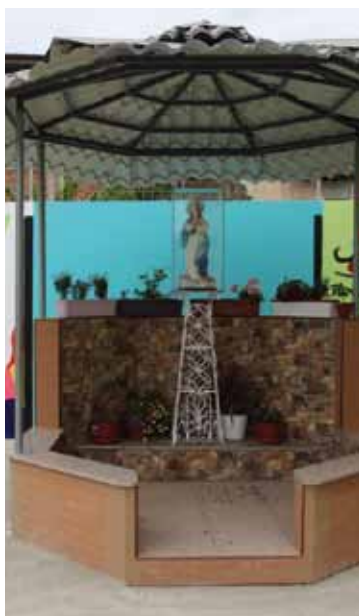
Die Muttergottesstatue Unsere Liebe Frau vom Licht (Gymnasium Leoní Aviat) überstand wie durch ein Wunder das Erdbeben unbeschädigt.

Die Schülerinnen und Schüler begnügen sich einstweilen mit den Schulbaracken, die uns der Staat zur Verfügung gestellt hat und die sie mit den Schülerinnen und Schülern des staatlichen Gymnasiums teilen müssen. Schulräume, die zu klein und zu heiß sind und wo es nicht einmal den kleinsten Komfort gibt. Staub, Schlamm, Schweiß und fehlende Privatsphäre sind die täglichen Begleiter unserer 12 bis 17-jährigen Schüler, aber trotz allem sind sie davon überzeugt, dass auch sie bald in ihrem eigenen Gymnasium unterrichtet werden. Aus diesem Grund harren sie geduldig aus, ohne ein anderes privates Gymnasium zu suchen, denn was sie und ihre Eltern wünschen, ist die ganzheitliche Schulerziehung mit einem hohen akademischen