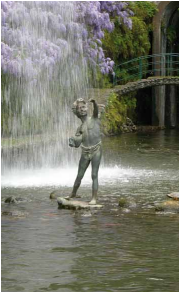
Gott ist Leben und spendet Leben dem, der glaubt.