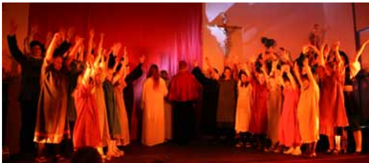
Das Musical „Die Baronin“ zieht Kreise

blenz (8. März 2013) statt. Im Musical-Oratoriums nach Sachsen geplant. ■