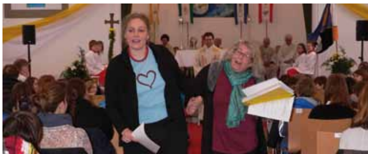
Ein salesianischer Sketch mit Herz und Verstand

Die Religionslehrerinnen spielten einen Sketch mit dem Titel „Mit Herz und Verstand durchs Leben gehen“. Er griff das diesjährige Jahresmotto von Niedernfels auf: „Das Gewöhnliche außergewöhnlich gut tun“ – ein Leitspruch von Franz von Sales. Die beiden Darstellerinnen zeigten, dass es weder eine Lösung