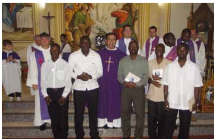
Die fünf Neuprofessoren im Kreise ihrer Mitbrüder