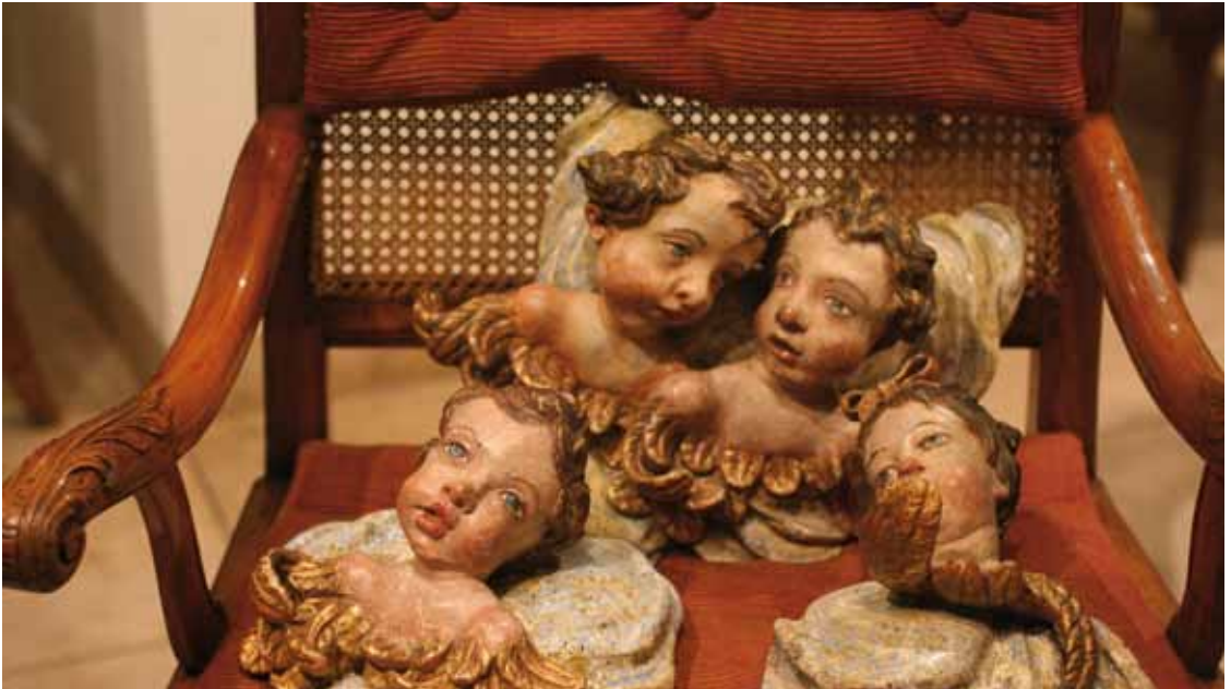
Gott zersprengt Systeme und Traditionen – nur um eins zu tun: zu lieben.

über einen Mitmenschen. der jeder objektiven Wahrheit entbehrt. Der drohenden Stimme des Pfarrers als Warnung vor der Hölle. Der Angst machenden Predigt der Weltuntergangstheoretiker. Den immer alles besser wissenden Rat-schlagserteilern, die in Wahrheit Ihre konkrete Situation gar nicht einschätzen können.