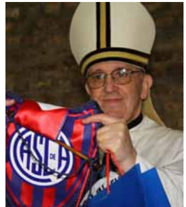
Der „Papa emeritus“ Benedikt XVI. und sein Nachfolger Franziskus mit dem Fußballtrikot von „San Lorenzo“

lieben, ohne im Gegenzug etwas von Gott zu verlangen, und seiner göttlichen Liebe ganz vertrauen“. Für Papst Benedikt war das die Grundhaltung, die Franz von Sales lebenslang begleitet.