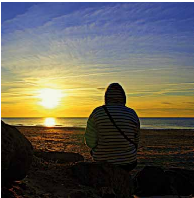
Jeden Morgen müssen wir uns entschließen, Gott noch mehr treu zu sein.

entschlossener ausführen. Ja, ich beschwöre euch, das zu tun, denn die Zeit drängt [...]. Sollten etwa Sorgen, Arbeiten und Geschäfte unsere Gottvereinigung hindern können? Keineswegs. Je stärker die Versuchung uns bestürmt, umso enger klammern wir uns an Gott. Je mehr sie unsere Seele bis oben anfüllt, umso entschlossener halten wir uns an ihn. Dann ist der Augenblick gekommen, aus der Tiefe unseres Herzens ein glühendes Gebet zu ihm zu schicken: „Aus der Tiefe rufe ich, Herr, zu Dir ...“ (Ps 130,1).