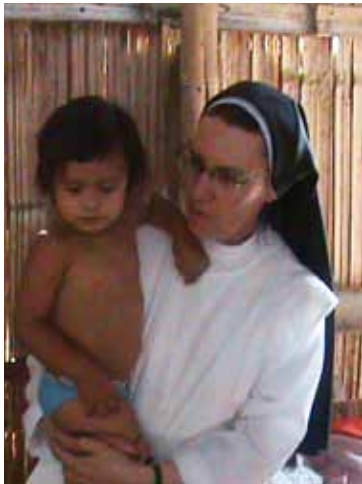
Dank Ihrer Hilfe haben kleine Kinder in Ecuador bessere Chancen