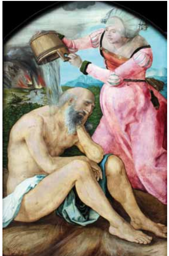
Grundehrlich und doch vom Schicksal gebeutelt, sogar von der eigenen Frau verspottet: „Ijob auf dem Misthaufen“, Gemälde von Albrecht Dürer

Der Druck, alles Angenehme, Praktische, Neue, Moderne ... haben zu müssen und zwar sofort, lastet auf vielen Menschen, auf vielen Familien, auf den Erwachsenen, aber auch auf den Kindern. Die Eltern wagen kaum, NEIN zu sagen, weil sie dadurch riskieren, ihre Kinder dem Gespött der Schulkameraden und Freunde auszusetzen.