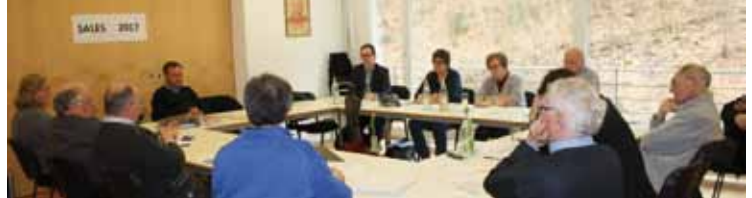
Die Arbeitsgemeinschaft tagt.