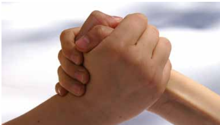
Ecken und Kanten gehören zur Freundschaft wie auch Zuverlässigkeit.

tauscht hat und nach knapp 1,5 Liter Wein nicht mehr viel vom guten Brot und vom Schinken gebraucht hat.