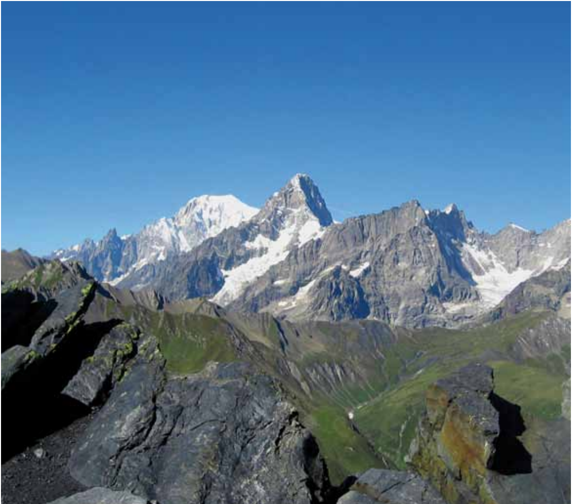
Franz von Sales lädt zu kleinen Schritten mit dem Blick zum Gipfel ein

Solches Staunen ist „nur ein Schaustück“, der Einstieg in mehr. Eine Einübung in Sehen, das mehr sieht als normal. Ein Einüben von Gehen, das ein Ziel vor Augen hat: Hineingehen in eine Welt, die bisher noch verborgen und verschlossen war. „Der Weg wächst im Gehen unter deinen Füßen wie durch ein Wunder“ (Reinhold Schneider).