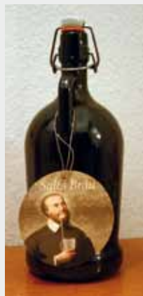
Selbstgebrautes Bier „Sales-Bräu“

sondern mit den Waffen der Liebe und des Gebetes geschieht. Gott ist kein strafender oder angstmachender Gott, sondern der Gott der Liebe. Im Anschluss an die Festmesse fand noch ein „erweitertes Kaffeehaus“ statt – mit Kaffee, Speisen und Getränken, einer Tombola und dem „berühmten“, selbst gebrauten „Sales-Bräu.“ ■