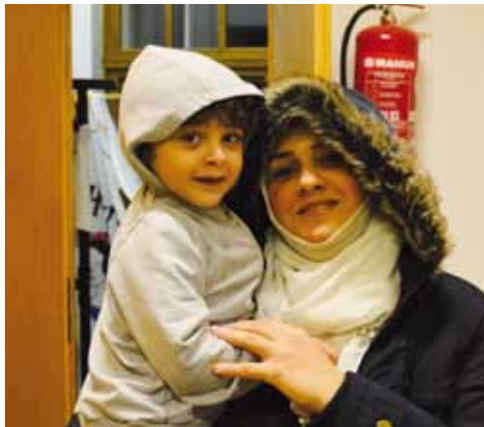
Gerade auch dank Ihrer Hilfe können wir dafür sorgen, dass Kinder nicht hungrig zu Bett gehen.

Auf Seiten der Behörden gibt es neben positiven Erfahrungen mit engagierten Beamten teilweise extrem lange Wartezeiten auf Termine. Manche Flüchtlinge zittern der Entscheidung, ob sie Asyl erhalten, zwei Jahre und mehr entgegen. Währenddessen dürfen