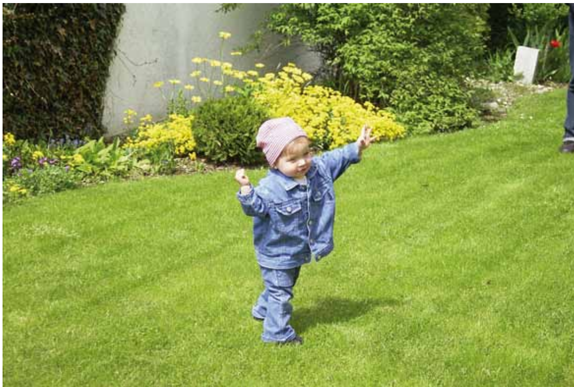
Ich darf vor Gott so sein, wie ich bin.

gewünschten Ziel. Doch dies sollte uns keine Angst machen. Im Vertrauen auf Gottes Wissen und seine Güte können wir beruhigter leben. Wir müssen keine Angst haben, ob unser Handeln Gott gefällt. Wenn wir versuchen, nach unseren Möglichkeiten nach den christlichen Lehren zu leben, dann wird Gott uns bestimmt keine Vorwürfe machen und uns in seiner Güte aufnehmen. In diesem Wissen ist es ganz einfach, Gott zu lieben und seine Liebe weiterzutragen. Und es gibt doch nichts Wertvolleres als das Wissen, geliebt zu werden und nicht nach seinen Ergebnissen bewertet zu werden, wie es in unserer kommerzialisierten Welt üblich ist, sondern danach, wie wir sind und wie wir handeln oder versuchen zu handeln.