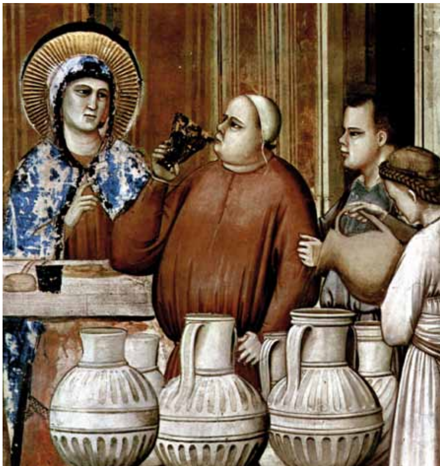
Sie glaubten Christus, und Wasser wurde zu Wein (Hochzeit von Kana, Ausschnitt aus einem Fresko von Giotto di Bondone in der Scrovegni-Kapelle, Padua, Italien)

es nichts als Wasser. Die Sensation bei heiligen Dingen, dass man das Kostbare kosten und auskosten muss, um zum (süßen) Kern der Sache zu kommen.