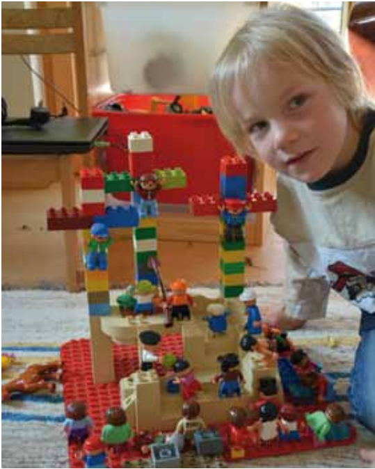
Mit ganzem Herzen und sehr konkret: Wie Kinder auf die Passion Jesu zugehen

seren Beruf, unseren Alltag, unsere Gesundheit ... Und ist dies alles bei einer nicht „greifbaren“ Macht wie Gott nicht noch tausendmal schwerer?