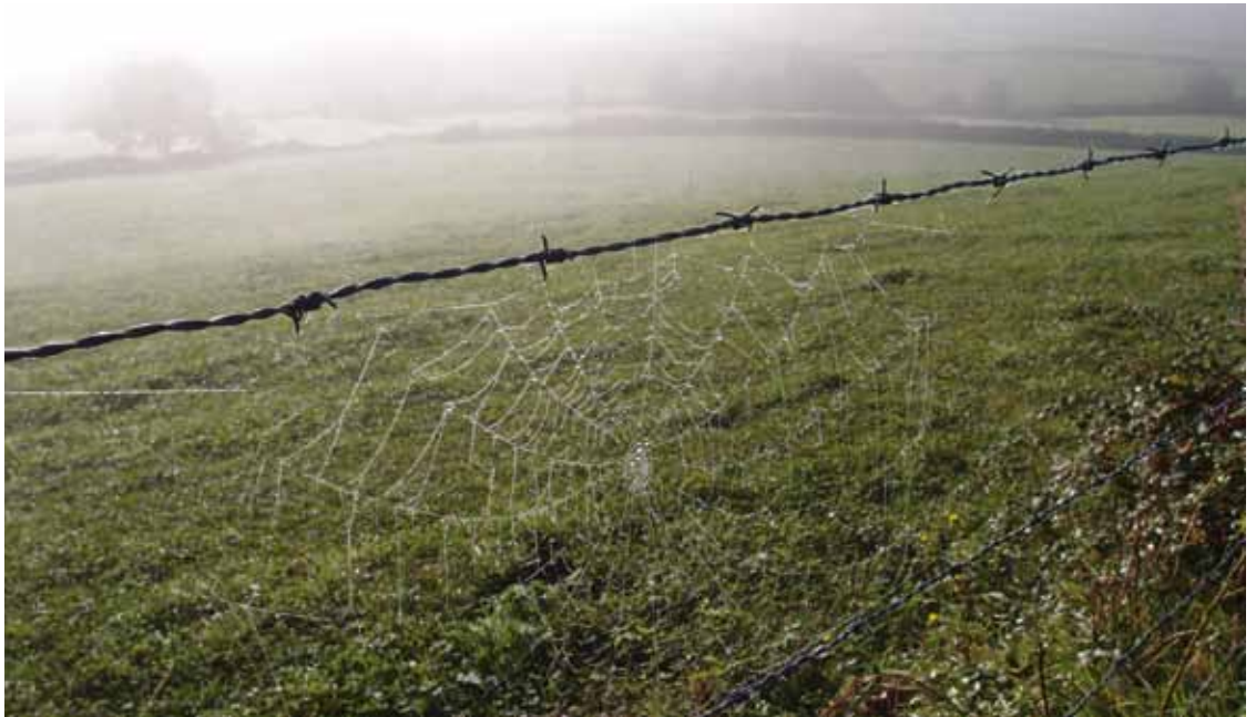
Man atmet Leben, wenn die kühle Luft, feucht vom Nebel, dem Körper die Kraft zum Gehen schenkt

Da streiten sich zwei, und ich weiß nicht, wie der Kampf ausgeht. Oft ist es die Geschwindigkeit, das immer Neue, das ANDERE, das mich