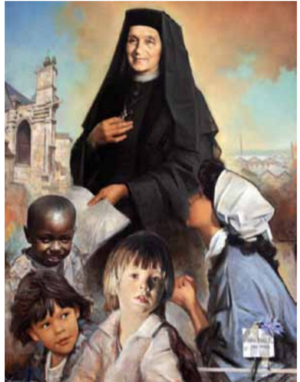
Seit ihrer Profess lebte Schwester Franziska Salesia Aviat konsequent nach der Devise „Sich selbst ganz vergessen“ (Bild, das bei der Heiligsprechung 2001 enthüllt wurde)

Schwester Franziska-Salesia hat nie über ihre Eindrücke jener Tage gesprochen. In