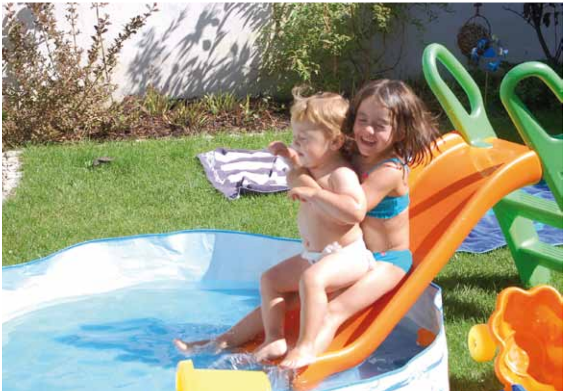
Sich auch mal etwas ZUTRAUN.