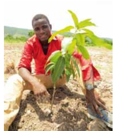
Ein jeder durfte einen Setzling „adoptieren“

So wurden insgesamt 52 Mango-Bäume von unseren Kindern und Jugendlichen „adoptiert“ und ihre Lage genau vermerkt.