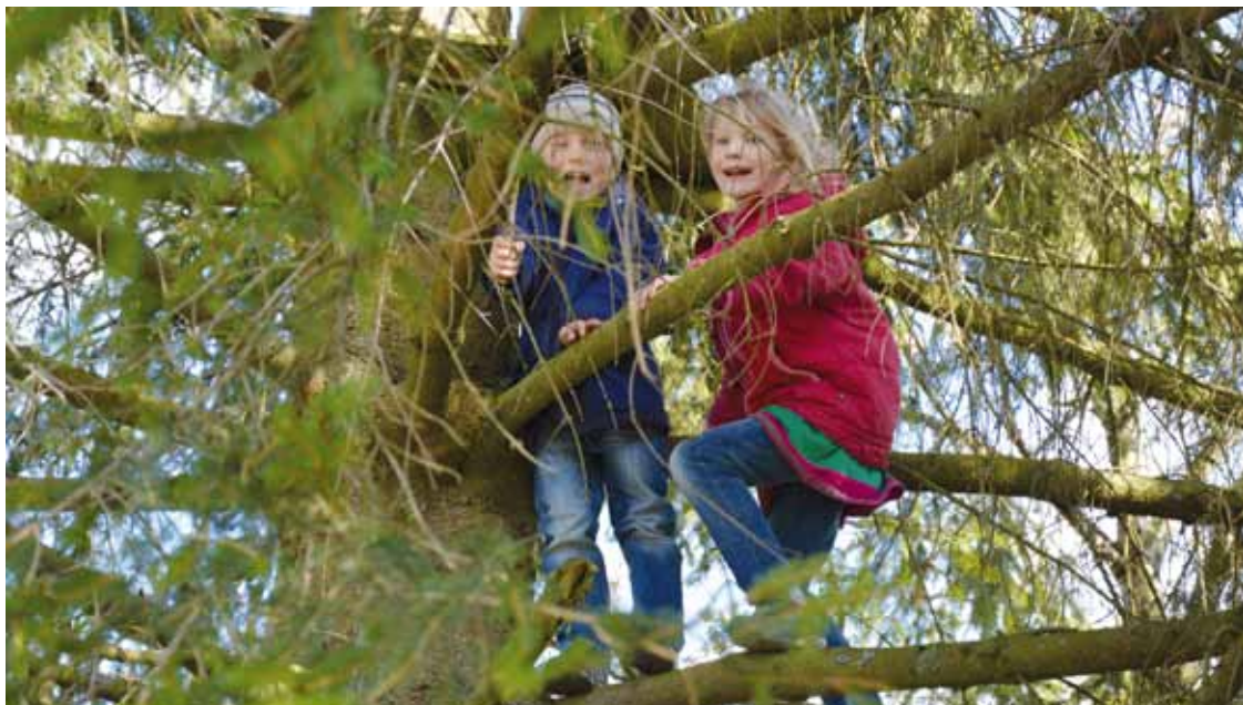
Vor Gott dürfen wir auch einmal wie ein Kind sein

Und trotzdem ist es ein schönes Gefühl, das unerschütterliche Vertrauen unseres Sohnes zu spüren, wenn sich seine kleine Hand in meine schiebt, wenn wir auf einem unsicheren Weg gehen. Oder wenn er sich geradewegs in meine Arme fallen lässt – ohne je einen Gedanken darauf verschwendet zu haben, ich könnte ihn nicht auffangen. Wir können ihm Sicherheit und Halt geben.