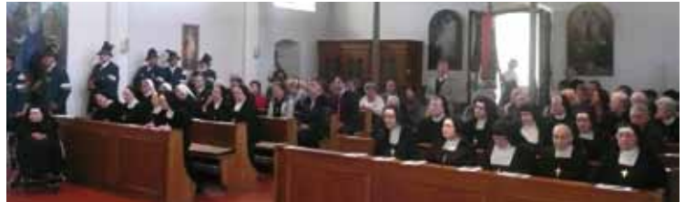
Es ist Zeit, Adieu zu sagen: Abschlussgottesdienst in Beuerberg

gemeinschaften geführte Alten- und Pflegeheime zu übersiedeln, wo sie nun ihren wohlverdienten Ruhestand leben können. Ein Teil der Schwestern wird von den Franziskanerinnen von Schönbrunn bei Dachau, Bayern, aufgenommen, ein anderer Teil von den Barmherzigen Schwestern des heiligen Vinzenz von Paul in Bad Adelholzen, Bayern.