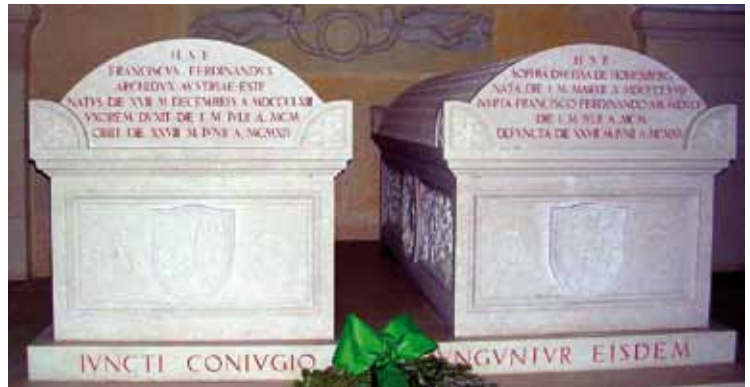
Grabmäler von Thronfolger Franz-Ferdinand und seiner Gemahlin Sophie in der Fürstengruft von Artstetten

Um ½ 3 Uhr nachts weckt uns die Klostersglocke. Zehn Minuten darauf heißt es, der Kondukt wäre vorzeitig angekommen und schon hört man dumpfes Rollen. Waren das etwa Salutschüsse? Rasch eilen alle Klosterbewohner zur Kirche hinauf. Doch stockfinstere Nacht umfängt sie vor dem Hause, grelle Blitze blenden das Auge und zaubern die Landschaft in Tageshelle aus der grausigen Nacht hervor, grollender Donner erhöht das Geheimnisvolle dieser Nacht. Wir begeben uns zum Eingang des Parkes, von wo die beiden Leichen zur Kirche geleitet werden sollten. Dort gewahren wir beim Kerzenschein der Bewohner des Marktes einen mit Kränzen beladenen Wagen. Man teilt uns mit, dass in Pöchlarn, der Bahnstation, von der