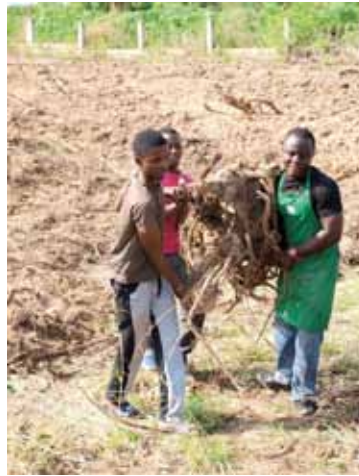
Wegräumen der Äste und Wurzeln

den derzeit im Projekt wohnenden Kindern und Jugendlichen, als auch mit den Ehemaligen anrückten.