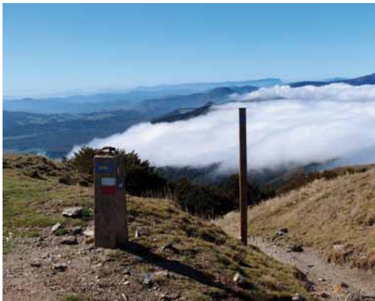
Hier heroben trifft man tatsächlich Gott – aber keine Theologen

treibt. Die Langsamkeit ist gar nicht so einfach zu ertragen. Es ist nicht, dass ich mir ein Rad, ein Moped, ein Auto wünsche, um schneller in Santiago zu sein. Oft ist es aber das Noch-ein-wenig-Weitergehen, das Schneller-Gehen, das ich möchte, aber Gott sei Dank mein Körper nicht vermag. Und irgendwann wird es ruhig, ganz ruhig. Atemberaubende Stille, hin und wieder ein Vogel, und in der Ferne das Geläut von weidendem Vieh. Sitzen, nicht mehr Gehen. Ein Geschenk, hier sein zu dürfen und guten französischen Käse zu genießen.