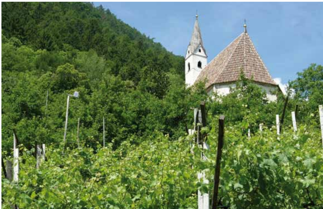
Gott ist so reich an Schönheit, wenn man die Augen aufmacht dafür

Staunen-können reicht in die Spitze unseres Geistes und weitet uns zunächst für das Umfeld, das uns die Sinne einbringen. Wie sich der Blick bei einem Berganstieg weitet und das Licht heller wird, so wird die Welt-Erfahrung eine Brücke in die Welt Gottes.