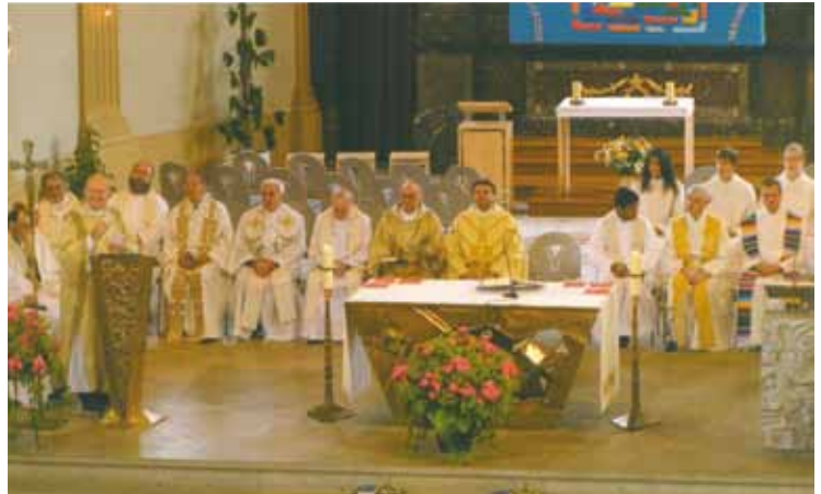
Die Zelebranten beim Gottesdienst

Sales-Oblaten feierten 75 Jahre Thaddäusheim Düdingen in der Schweiz