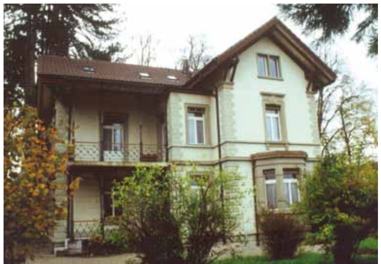
Das Thaddäusheim in Düdingen, Schweiz