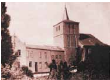
Links das Kloster, rechts die Pfarrkirche um 1916

Nach einem Friedensschluss im Krieg zwischen den „Deutschen Schutztruppen“ und der einheimischen Bevölkerung im heutigen Namibia durfte der Oblatenpater Johannes Malinowski, der in dem Frieden vermittelte, dem deutschen Kaiser Wilhelm II. gegenüber einen Wunsch äußern. Er entschied sich für die Zulassung einer Gründung der Oblaten in Preußen, was nach den Gesetzen des Kulturkampfes ausgeschlossen war.