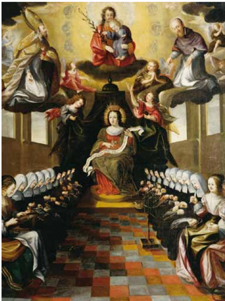
Franz von Sales legte den Schwestern ans Herz, nachgiebig zu sein. Heimsuchungsschwestern unter dem himmlischen Schutz des hl. Franz von Sales, Öl auf Leinwand, 1641, Gemälde in der Pfarrkirche von Freneuse (Seine-Maritime), Frankreich.