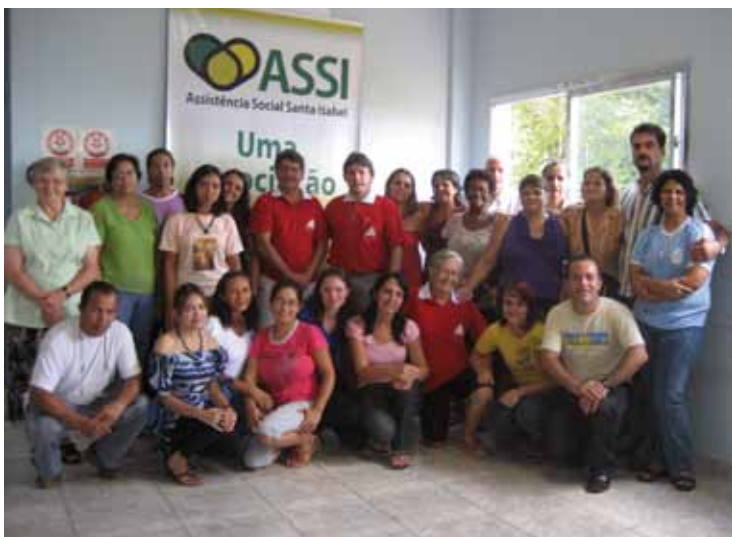
Die Hand am Teig: Unsere Mitarbeiterinnen und Mitarbeiter