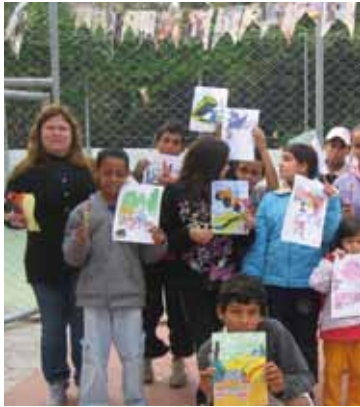
Entscheidend ist die personale Präsenz.

Für die LICHT-Aktion 2011 wurden bereits mehr als 10 000 EUR gespendet. Im folgenden Beitrag berichtet P. Valdir Formentini OSFS über die ehrenamtlichen Mitarbeiter bei dem Straßenkinderprojekt in Brasilien und verbindet dies mit dem herzlichen Dank an die Spender.