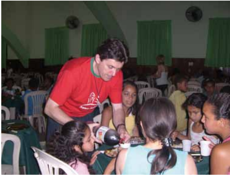
Dienst an den Kindern und Jugendlichen

und selbstlosen Einsatz der wertvollen Mitarbeiter, die viel Zeit investieren und ihre Arbeit wirklich im Schweiß ihres Angesichtes tun – und die so „die Hand im Teig“ haben.