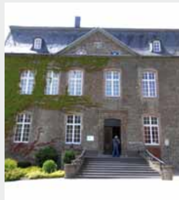
Offenes Haus: Haus Overbach am Tag des offenen Klosters

Am Sonntag, 3. Juli 2011, öffneten zum dritten Mal viele Klöster im Bistum Aachen ihre Pforten zu einem Tag der Begegnung. Auch die Sales-Oblaten in Haus Overbach haben sich beteiligt. Nach der Messfeier fand die in diesem Jahr neu eingeführte Overbacher Matinée mit einem Streichensemble und zwei Trompeten (zum größten Teil bestehend aus Overbacher Schüler/Schülerinnen) statt. Nach dem Mittagessen gab es Gelegenheiten, an Führungen durch Kloster, Schloss, Klosterkirche und Science College teilzunehmen. In der Krypta zeigte eine Powerpointpräsen-